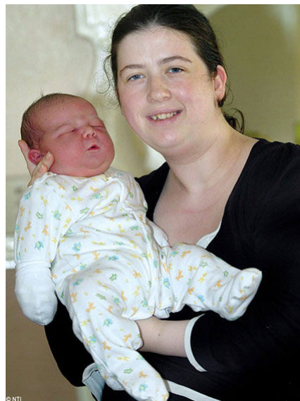
© NTI Shaune (6,7 kg) en los brazos de su mamá Vía | DailyMail.co.uk

Sin embargo, según el libro Guinness de los Récords , el bebé más pesado fue dado a luz por la canadiense Anna Haining Bates, el 19 de enero de 1879. Pesó 10,6 kg y midió 71 centímetros pero murió 11 horas después de nacer.